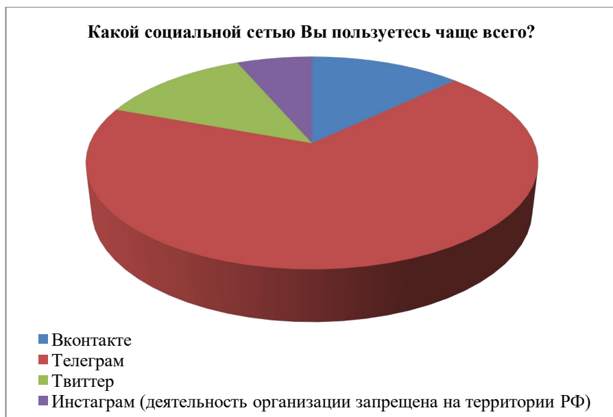
Рис. 3. Анализ самой популярной сети среди молодежи

Отвечая на вопрос, касающийся социальной сети, которой пользуются студенты чаще всего, большая часть респондентов подчеркнула значимость телеграмма в повседневной жизни. Действительно, этот универсальный мессенджер на протяжении последних 18 месяцев занимает второе место в рейтинге социальных сетей по версии AppStore. На территории нашей страны этой социальной сетью пользуются более 51 миллиона человек.