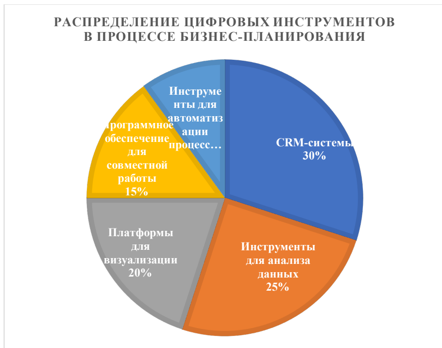
Рисунок 1. Распределение цифровых инструментов в процессе бизнес-планирования [4]

Термин «цифровые технологии» представляет собой особые технологии, которые позволяют создавать, хранить, обрабатывать и распространять данные в электронном виде, с помощью использования компьютерных и интернет-систем. К основным технологиям-представителям относятся: ИИ, машинное обучение, BigData, системы распределенного реестра (блокчейн), AI и т.д. Роль данных разработок на функционирование бизнес-процессов объективно велика. А распределение подобных инструментов и их вовлеченность в процесс бизнес-планирования отображены на Рисунке 1.