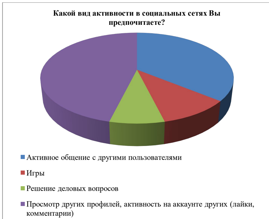
Рис. 4. Анализ активности студентов в социальных сетях

О том, чем занимаются студенты в социальных сетях, можно сделать вывод, исходя из рис. 3.